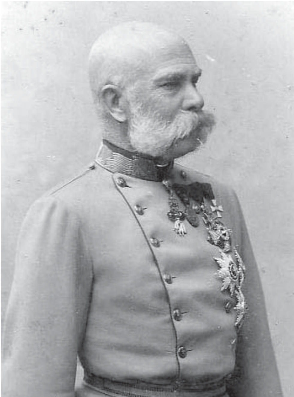
Kaiser Franz Joseph I. (1830–1916)