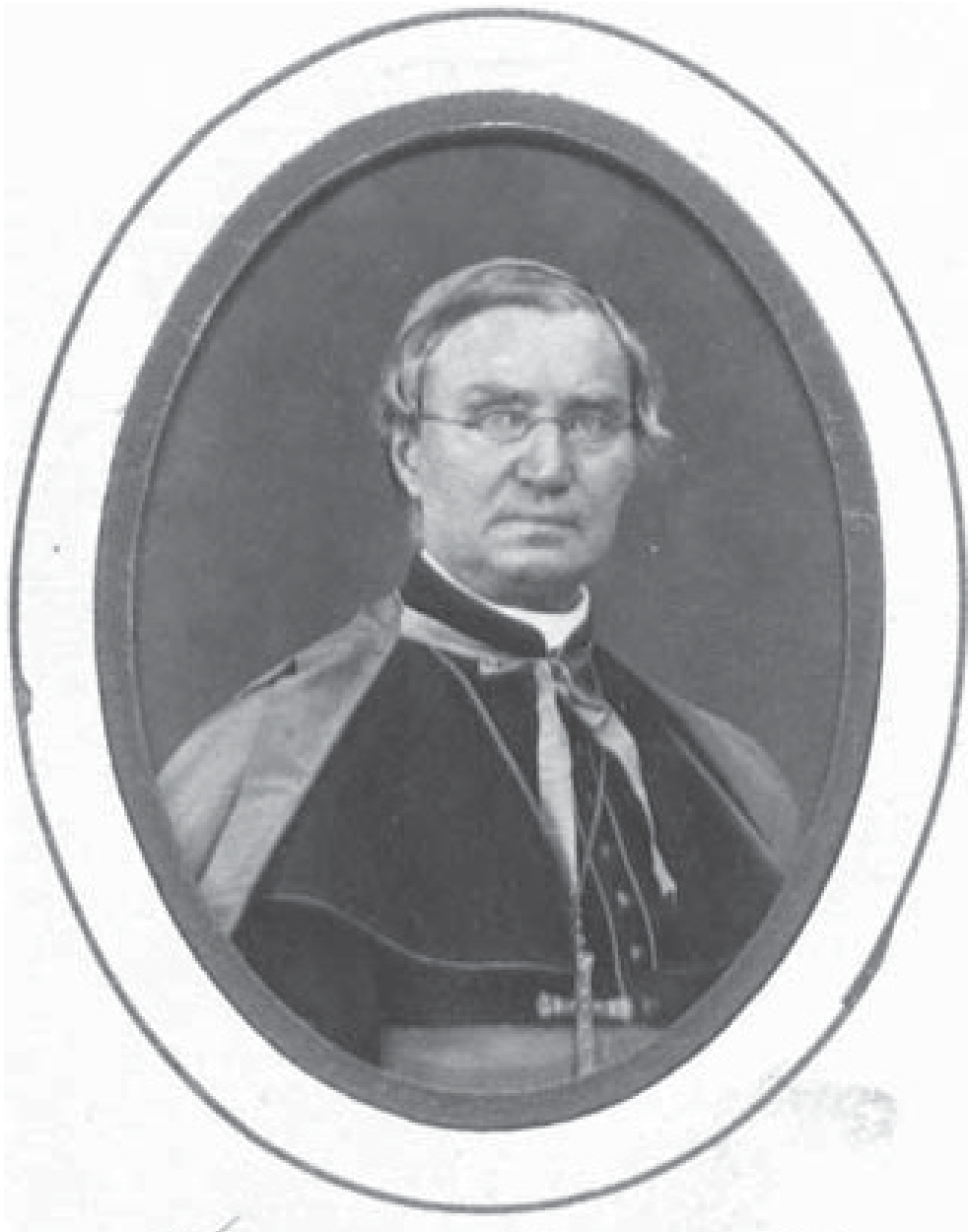
Bischof Georg Anton von Stahl (1805–1870), Würzburg