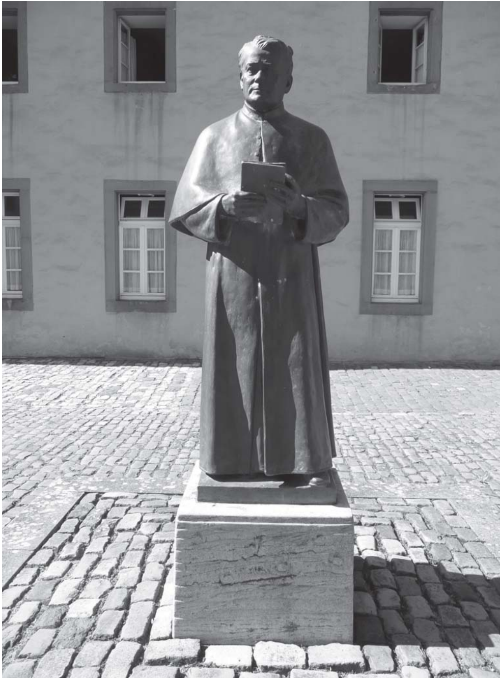
Denkmal von Pater Johann Baptist Jordan (Franziskus Maria vom Kreuze) im Kloster Steinfeld