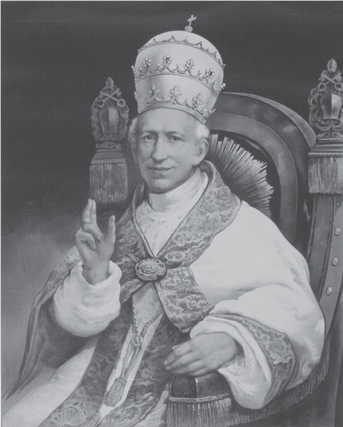
Papst Leo XIII. (1810–1903)