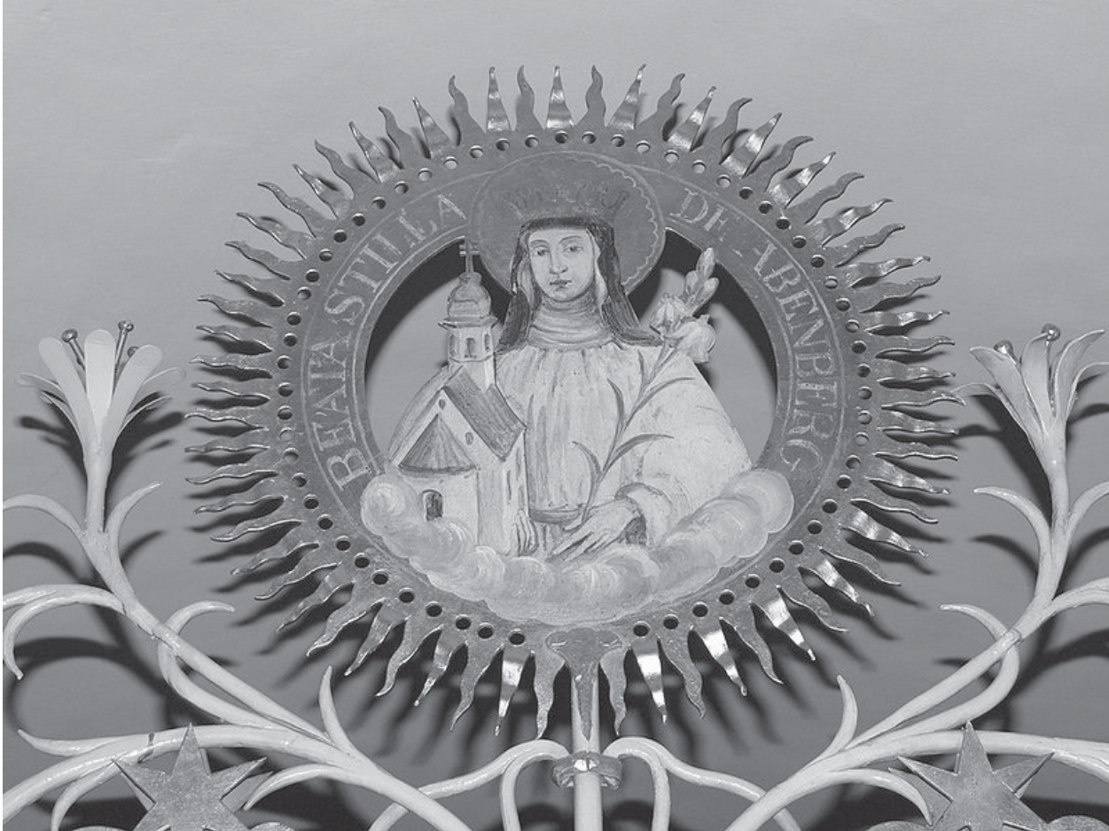
Bild der seligen Stilla von Abenberg (gestorben 1140) am Chorgitter von St. Peter im Kloster Marienberg (Abenberg)