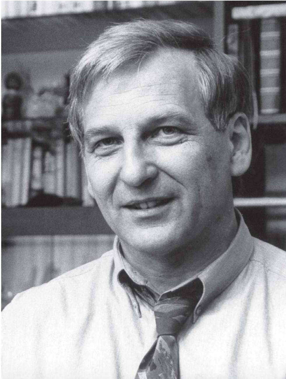
Autor Ernst Probst