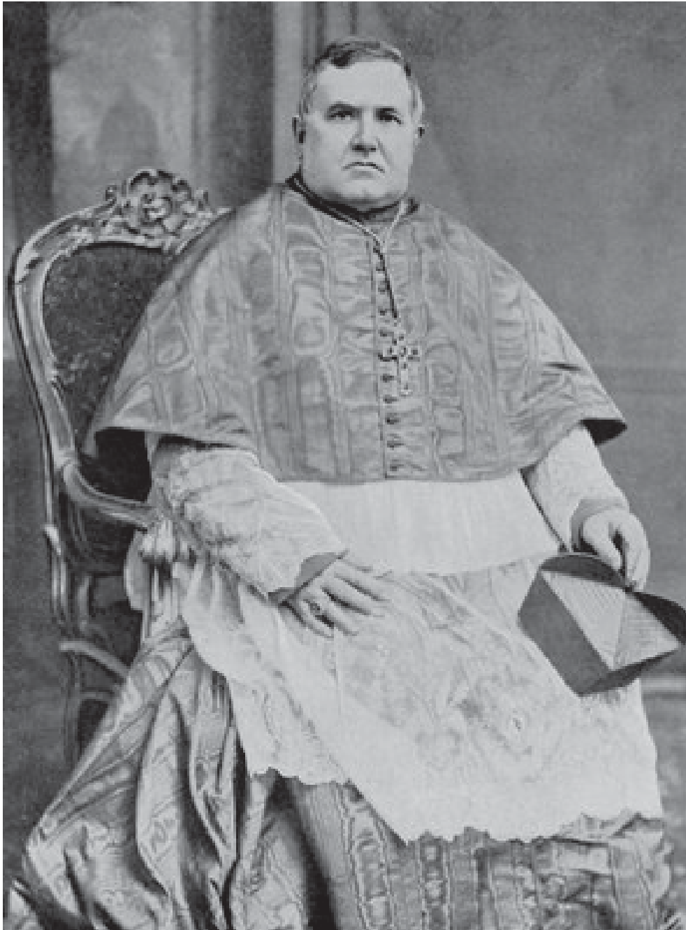
Kardinalvikar Lucidus Maria Parocchi (1833–1903)