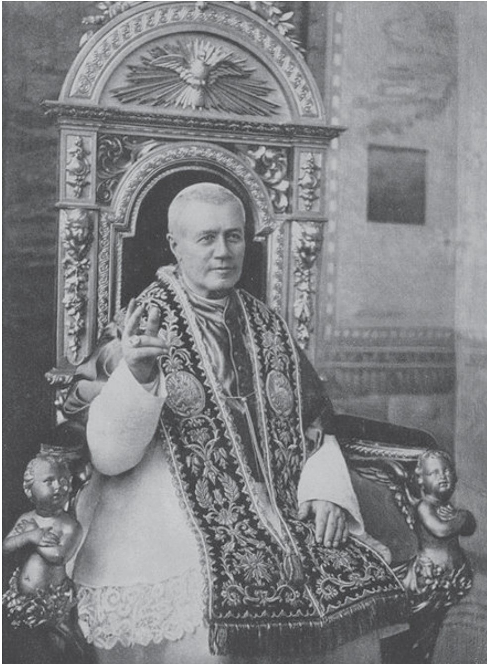
Papst Pius X. (1835–1914)