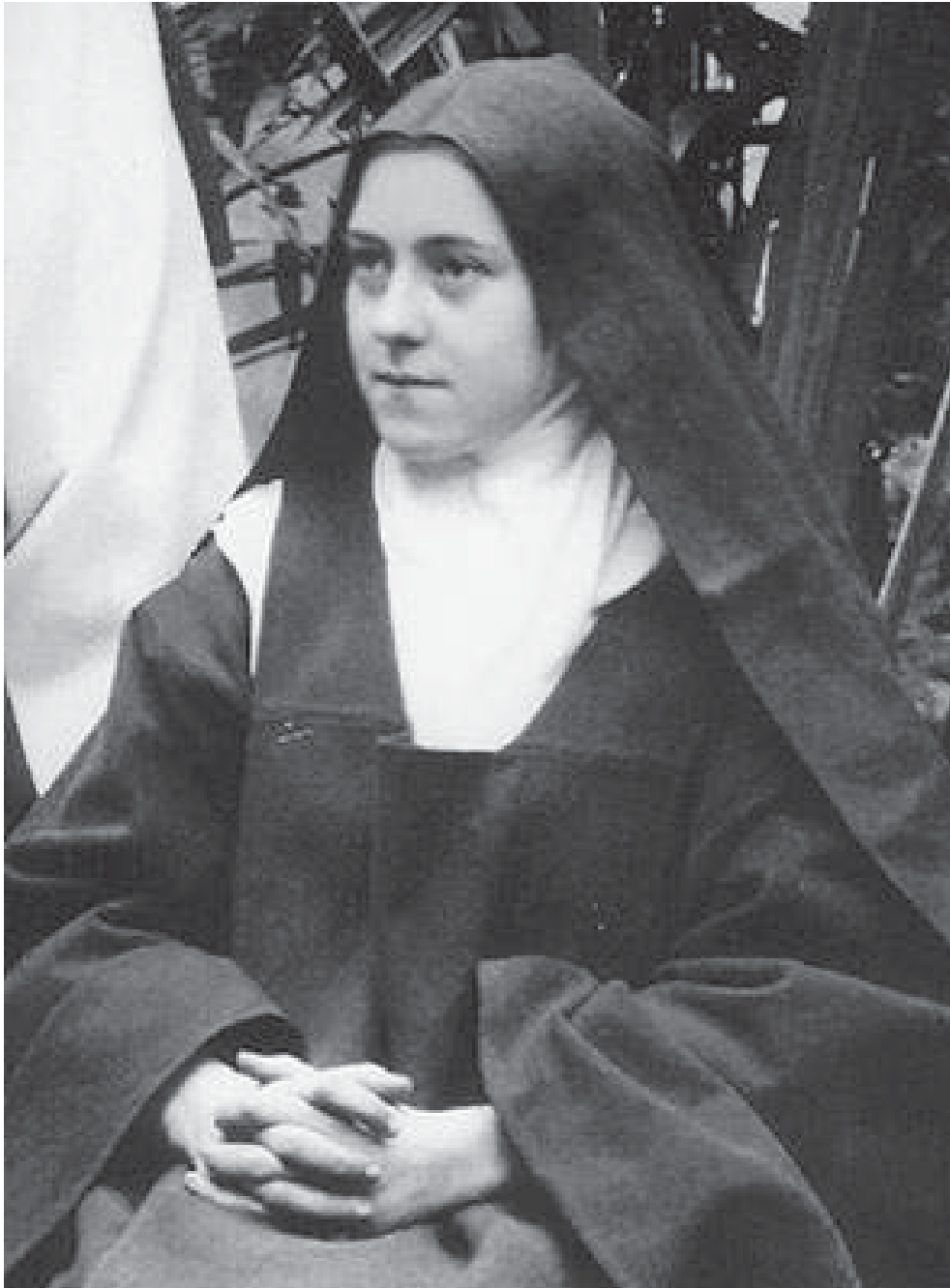
Heilige Theresia von Lisieux (1873–1897)