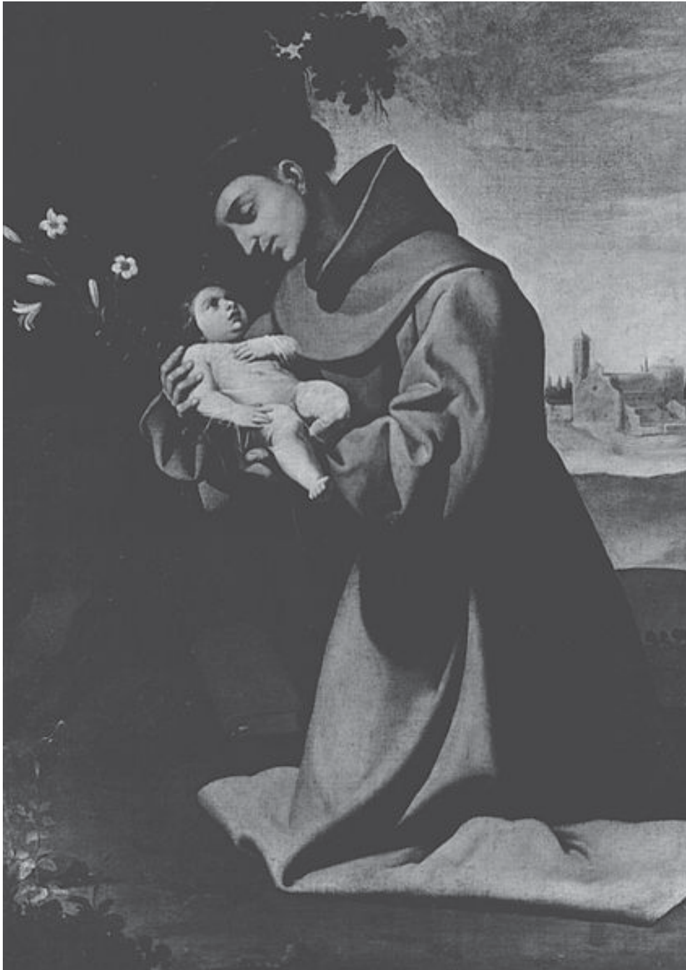
Heiliger Antonius von Padua