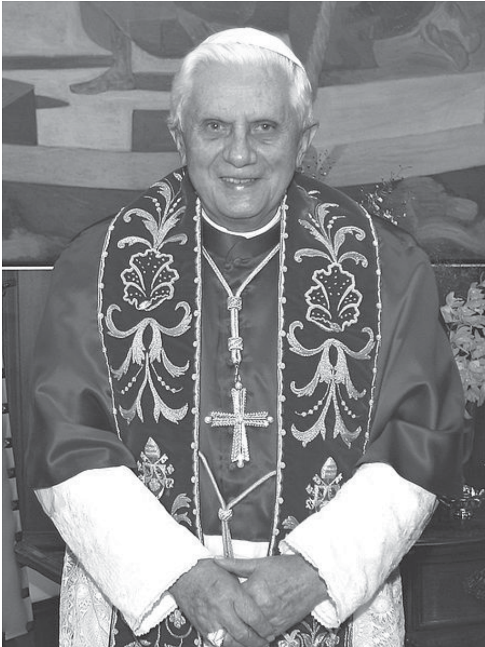
Papst Benedikt XVI.