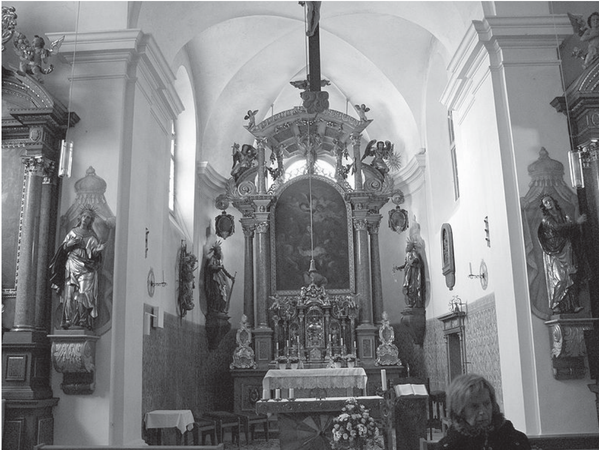
Foto auf Seite 66: Barocker Hochaltar der Stiftskirche St. Peter im Kloster Marienburg in Abenberg bei Schwabach (Mittelfranken) im ehemaligen Augustinerinnenkloster Marienburg.