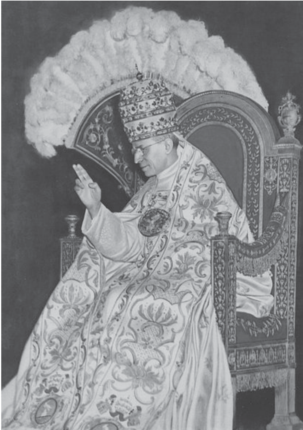
Papst Pius XII. (1876–1958)