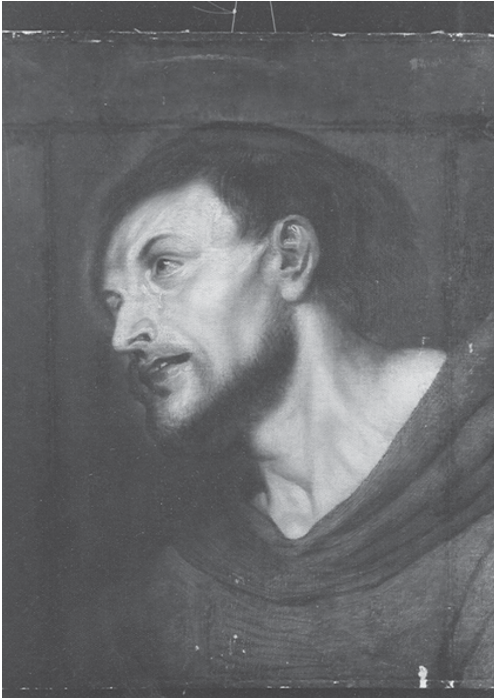
Heiliger Franz von Assisi (1182–1226)