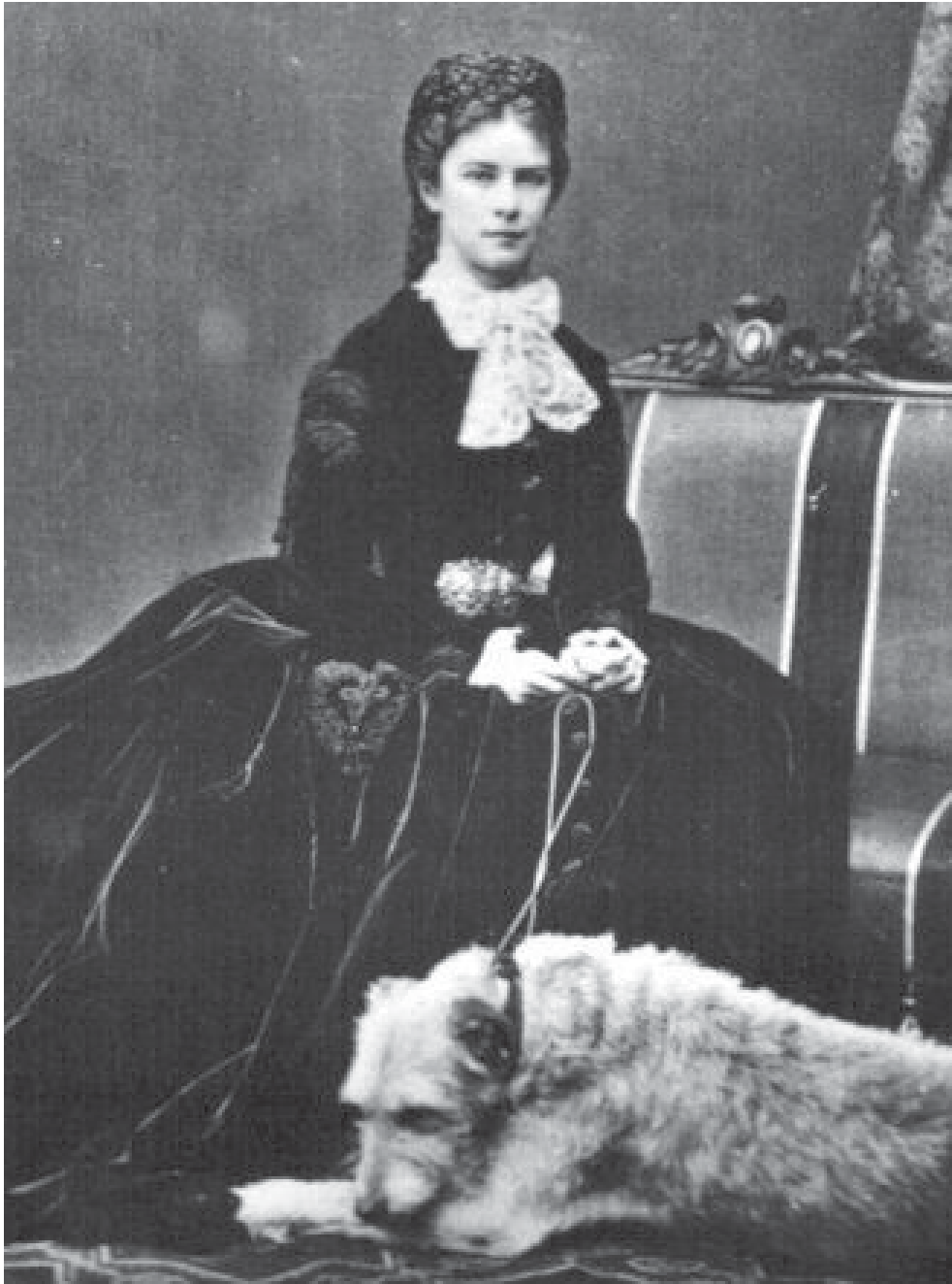
Kaiserin Elisabeth (1837–1898), genannt „Sisi“